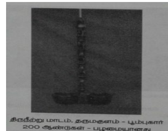
படம் - 3