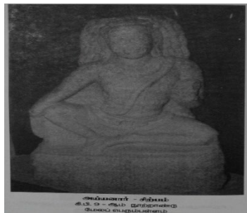
படம் - 1