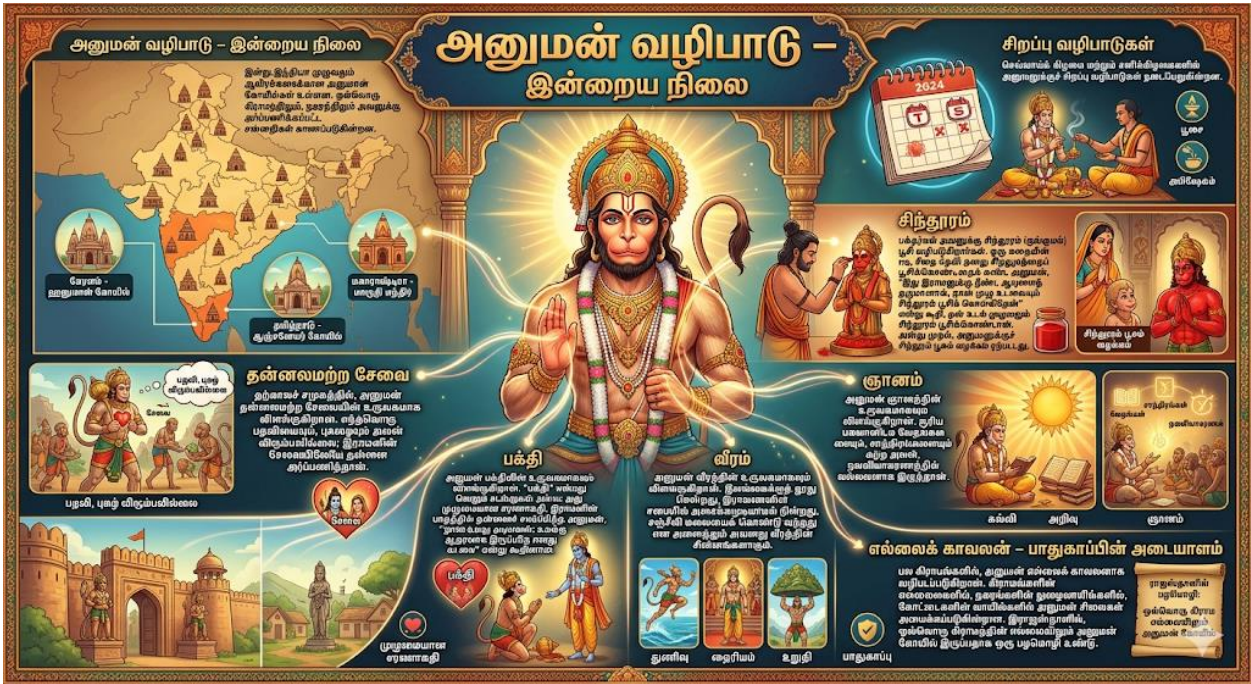
படம் 7: அனுமன் – தற்காலச் சமூகத்தில் ஆறு உருவகங்கள்

பல கிராமங்களில், அனுமன் எல்லைக் காவலனாக வழிபடப்படுகிறான். கிராமங்களின் எல்லைகளில், நகரங்களின் நுழைவாயில்களில், கோட்டைகளின் வாயில்களில் அனுமன் சிலைகள் அமைக்கப்படுகின்றன. இராஜஸ்தானில், ஒவ்வொரு கிராமத்தின் எல்லையிலும் அனுமன் கோயில் இருப்பதாக ஒரு பழமொழி உண்டு. இது அனுமனின் பாதுகாப்புப் பண்பை உணர்த்துகிறது.