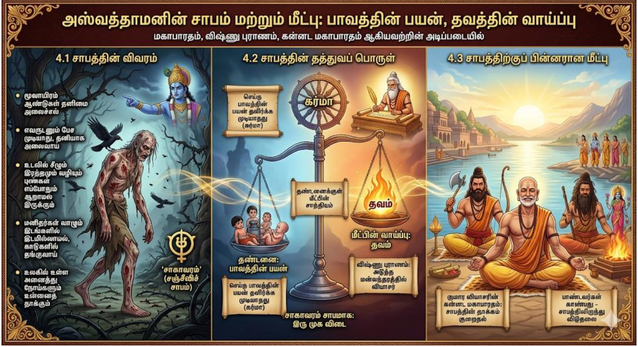
படம் 4: கிருஷ்ணனின் சாபம் – இருமுகத் தன்மை

மேலுள்ள வரைபடம் கிருஷ்ணனின் சாபத்தை மூன்று நிலைகளில் விளக்குகிறது. முதலாவதாக, தண்டனையாக – மூவாயிரம் ஆண்டுகள் தனிமை அலைச்சல், எவருடனும் பேச்சு இல்லாமை, உடலில் ஆறாப் புண்கள், மனிதர்கள் வாழும் இடங்களில் இடமில்லாமல், காடுகளில் தங்குவாய். இரண்டாவதாக, வாய்ப்பாக – தனிமையில் தவம் செய்தல், ஆன்மீக முன்னேற்றம், அடுத்த மன்வந்தரத்தில் வியாசராகப் பணியாற்றும் வாய்ப்பு ஆகியன. மூன்றாவதாக, மீட்பாக – பரசுராமரிடம் சக்தி வழிபாடு கற்றல், சாபத்தின் தாக்கம் குறைதல், கங்கைக் கரையில் மகிழ்ச்சியுடன் இருந்தமை ஆகியன. இம்மூன்று நிலைகளும் இணைந்தே அஸ்வத்தாமன் சிரஞ்சீவியானான். தண்டனைக்குள் மறைந்திருக்கும் மீட்பின் சாத்தியத்தை இவ்வரைபடம் காட்சிப்படுத்துகிறது.