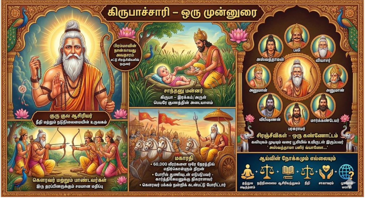
படம் 3: கிருபாச்சாரி - ஒரு முன்னுரை