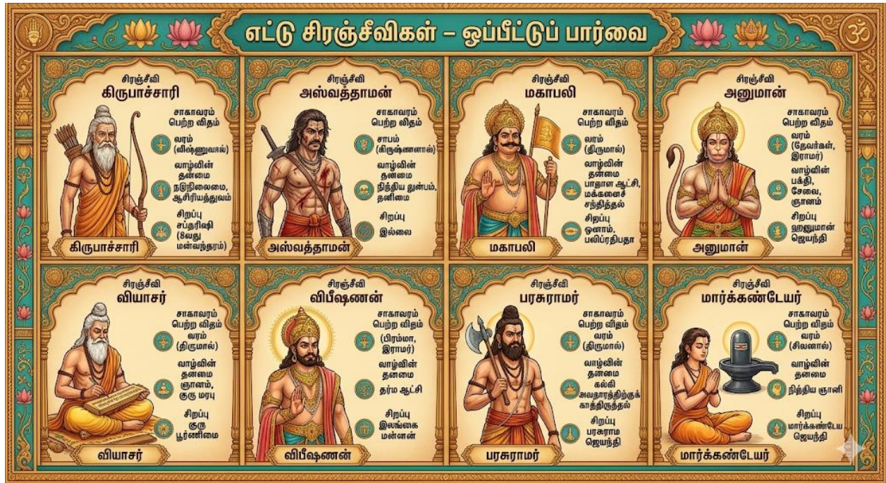
படம் 4: எட்டு சிரஞ்சீவிகள் – ஒப்பீட்டுப் பார்வை

"காலவர், தீப்திமான், பரசுராமர், அஸ்வத்தாமா, கிருபாச்சாரி, ரிஷ்யசிங்கர், மற்றும் நமது தந்தை பாதராயணர் (வியாசர்) ஆகியோர் எட்டாவது மன்வந்தரத்தில் சப்தரிஷிகளாக இருப்பார்கள்".