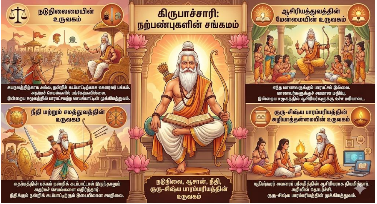
படம் 6: கிருபாச்சாரி – தற்காலச் சமூகத்தில் நான்கு உருவகங்கள்

இந்த அட்டவணை வடிவப் படம் கிருபாச்சாரியின் நான்கு உருவகங்களை விளக்கும். ஒவ்வொரு உருவகத்திற்கும் அவரது பண்பும், தற்காலச் சமூகப் பொருளும் இணைத்துக் காட்டப்படும். நடுநிலைமை, ஆசிரியத்துவம், நீதி, குரு-சிஷ்ய பாரம்பரியம் ஆகிய நான்கு பரிமாணங்களும் இன்றைய சமூகத்தில் அவரது தொடர்புடைமையை எடுத்துரைக்கும்.