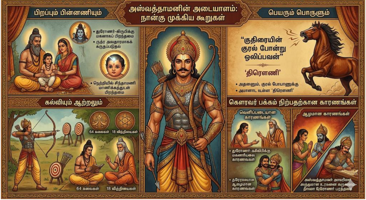
படம் 2: அஸ்வத்தாமனின் அடையாளக் கூறுகள்

அவனை மிஞ்சின. இந்த வெறுப்பே, துரியோதனனிடமான அவனது நட்பை வலுப்படுத்தியது (The Spiritual Scientist, 2014).