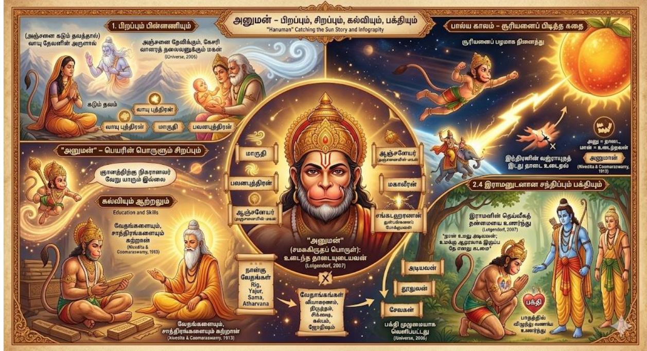
படம் 2: அனுமன் – குடும்ப மரமும் முக்கிய நிகழ்வுகளும்

இராமனின் பாதத்தில் விழுந்து வணங்கிய அனுமான், "நான் உமது அடியவன்; உமக்கு ஆதரவாக இருப்பதே எனது கடமை" என்று கூறினான். இந்தச் சந்திப்பே, அனுமனின் வாழ்க்கையை மாற்றியமைத்தது; அவனது பக்தி முழுமையாக வெளிப்பட்டது (iUniverse, 2006).