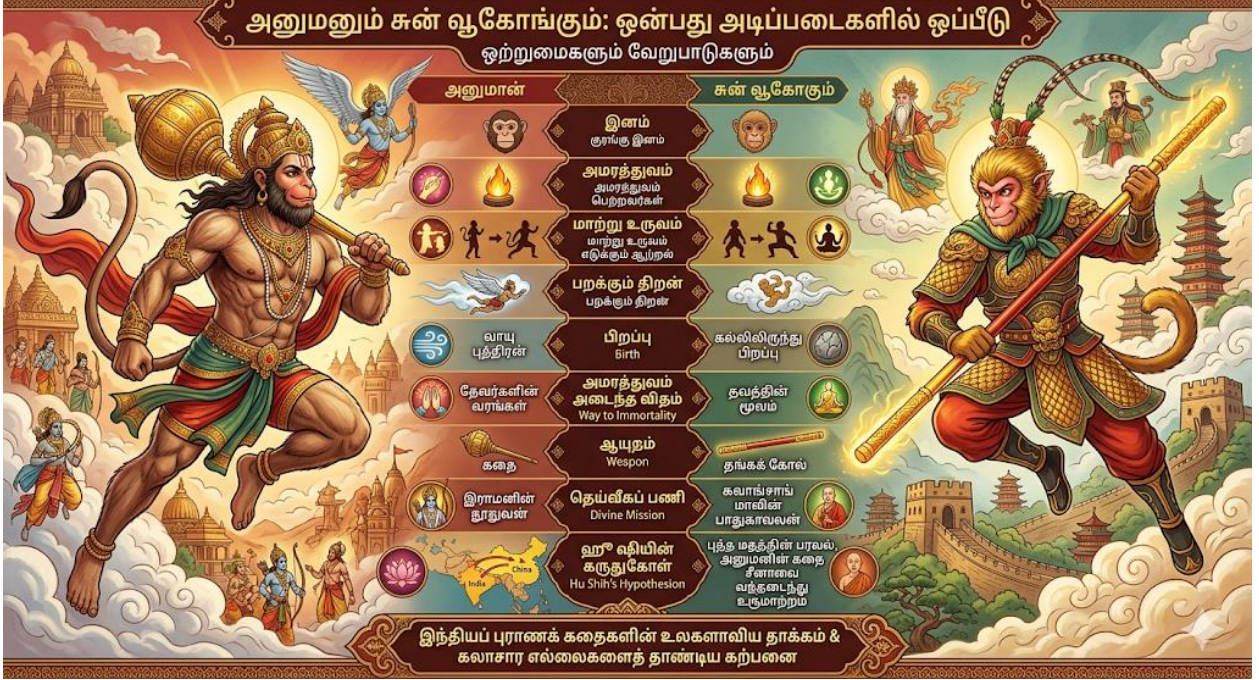
படம் 6: அனுமனும் சுன் வூகோங்கும் – ஒப்பீட்டுப் பார்வை

அனுமனுக்கும் சுன் வூகோங்குக்கும் இடையிலான ஒற்றுமைகள், இந்தியப் புராணக் கதைகளின் உலகளாவிய தாக்கத்தை உணர்த்துகின்றன. கலாசார எல்லைகளைத் தாண்டி, மனிதனின் கற்பனை எவ்வாறு ஒத்த கதாபாத்திரங்களை உருவாக்குகிறது என்பதற்கு இது ஒரு சிறந்த உதாரணமாகும்.