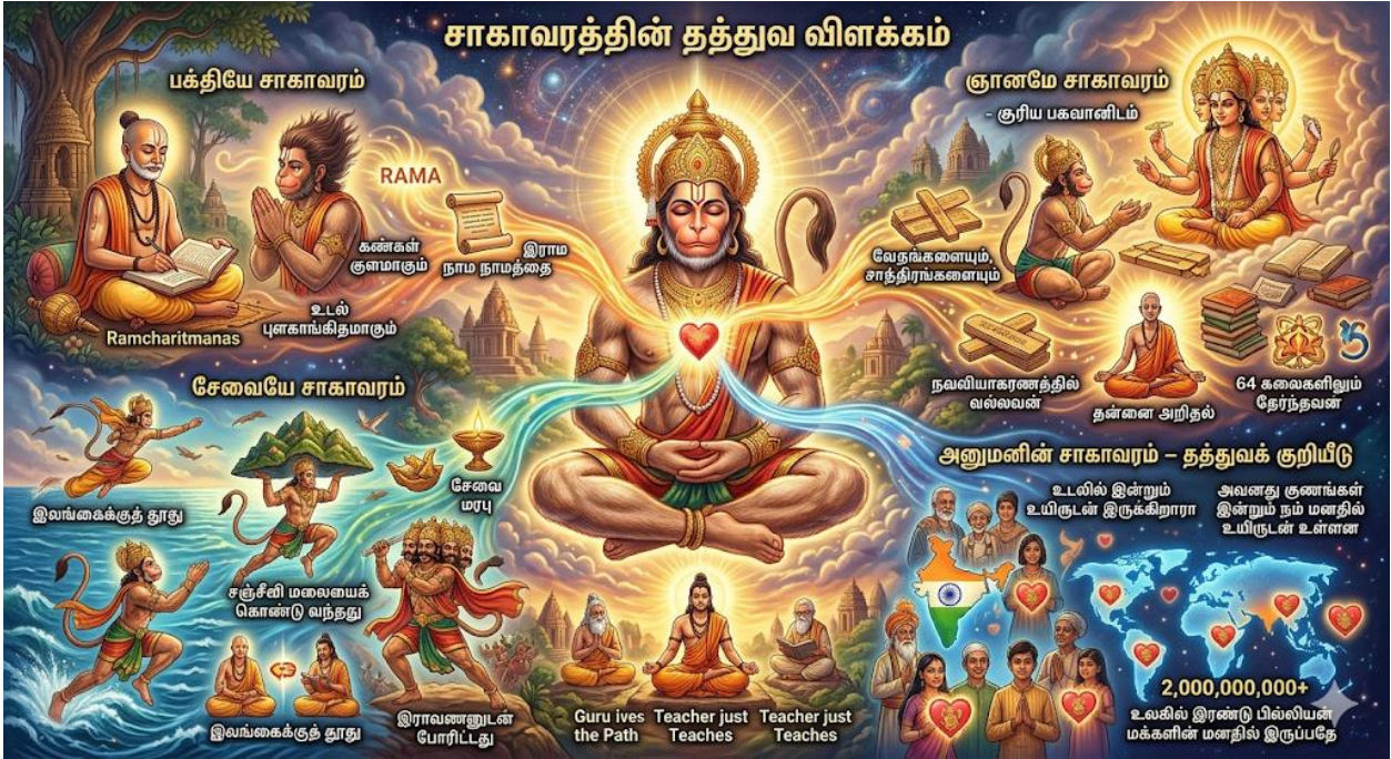
படம் 5: அனுமனின் சாகாவரத்தின் மூன்று தத்துவ அடித்தளங்கள்

ஒரு ஆய்வாளர் கூறுவதுபோல், "சாகாவரம் என்பது உடல் வடிவில் இருப்பது அல்ல; மாறாக, உலகில் இரண்டு பில்லியன் மக்களின் மனதில் இருப்பதே உண்மையான சாகாவரம்". அனுமன் இன்றும் இந்தியர்களின் மனதில் மட்டுமல்ல, உலகெங்கும் பரந்திருக்கும் இந்துக்களின் மனதில் உயிருடன் இருக்கிறான்.