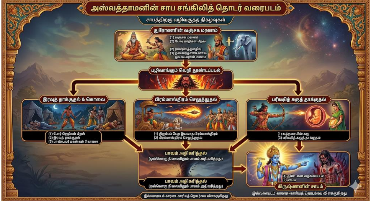
படம் 3: அஸ்வத்தாமனின் சாபத்திற்கு வழிவகுத்த நிகழ்வுகள்

மேலுள்ள வரைபடம் அஸ்வத்தாமனின் சாபத்திற்கு வழிவகுத்த நிகழ்வுகளைச் சங்கிலித் தொடராக விளக்குகிறது. துரோணரின் வஞ்சக மரணத்துடன் இத்தொடர் தொடங்குகிறது. இது அஸ்வத்தாமனின் பழிவாங்கும் வெறியைத் தூண்டியது. இவ்வெறியை மூன்று முக்கியச் செயல்களாக வெளிப்பட்டது: முதலாவது, போர் நெறிகளை மீறிய இரவுத் தாக்குதலும் பாண்டவர் மகன்களின் கொலையும்; இரண்டாவது, திரும்பப் பெற இயலாத பிரம்மாஸ்திரத்தைச் செலுத்துதல்; மூன்றாவது, உத்தரையின் கருவில் இருந்த பரீக்ஷித் கருவைத் தாக்குதல். இம்மூன்று செயல்களும் ஒவ்வொரு நிலையிலும் அஸ்வத்தாமனின் பாவத்தை அதிகரித்தன. இறுதியாக, இச்செயல்களுக்கான தண்டனையாகக் கிருஷ்ணனின் சாபம் வழங்கப்பட்டது. இவ்வரைபடம், காரண-காரியத் தொடர்பையும், ஒவ்வொரு செயலும் எவ்வாறு சாபத்தை நெருங்கச் செய்தது என்பதையும் காட்சிப்படுத்துகிறது.