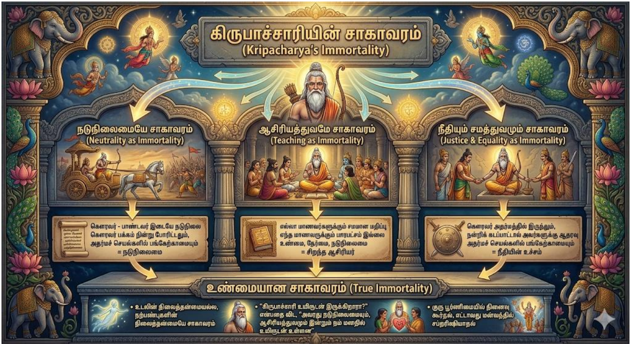
படம் 5: கிருபாச்சாரியின் சாகாவரத்தின் தத்துவ அடித்தளங்கள்

ஒரு ஆய்வாளர் கூறுவதுபோல், "சாகாவரம் என்பது உடல் வடிவில் இருப்பது அல்ல; மாறாக, அடுத்த தலைமுறைக்கு அறிவையும், நற்பண்புகளையும் அளிப்பதே உண்மையான சாகாவரம்".