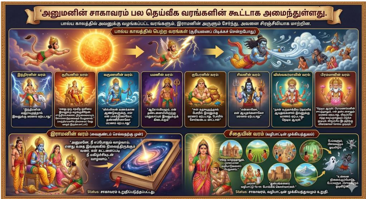
படம் 3: அனுமனின் சாகாவரத்திற்கான வரங்கள் – கூட்டுப் பார்வை

இந்த வரத்தின் மூலம், அனுமனின் சாகாவரம் மட்டுமல்ல, அவனது வழிபாட்டின் முக்கியத்துவமும் உறுதிப்படுத்தப்பட்டது.