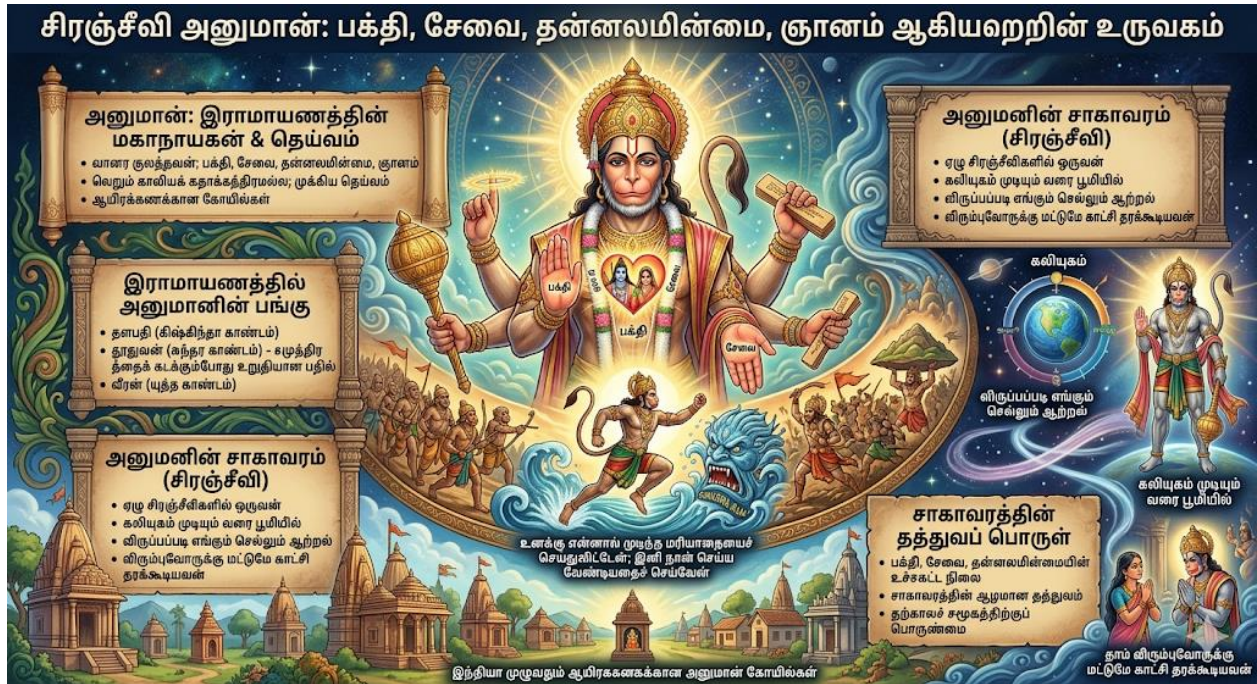
படம் 1: அனுமான் – அடையாளமும் சாகாவரமும்

இந்த ஆய்வின் நோக்கம், அனுமனின் சாகாவரத்தை வெறும் புராண நிகழ்வாக மட்டும் கருதாமல், அதன் தத்துவ அடித்தளங்களை ஆழ்ந்து நோக்குவதாகும். இதன் மூலம், இந்து மெய்யியலில் பக்தி, சேவை, தன்னலமின்மை, சாகாவரம் ஆகிய கருத்துகளின் இடைவெளிகளை விளக்கவும், தற்காலச் சமூகத்தில் இக்கதை எவ்விதப் பொருண்மையைக் கொண்டுள்ளது என்பதை ஆராயவும் இக்கட்டுரை முயல்கிறது.